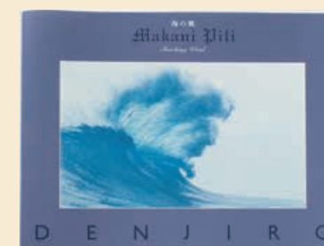
海の風 Makani Pili Touching Wind

写真：鷺尾和彦 / Kazuhiko Washio 寄稿：梨木香歩 / Kaho Nashiki デザイン：須山悠里 / Shuri Suyama 出版社：夕書房 / SEKI SHOBO