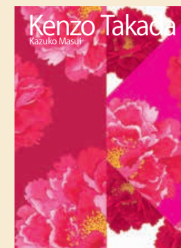
高田賢三 Kenzo Takada

出版社：アキオナガサワパブリッシング / Akio Nagasawa Publishing